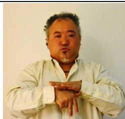
ストレス（指文字ス）